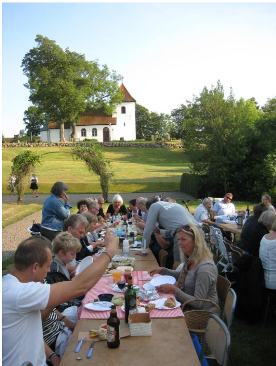
Bild från Happy Jazz knytkalaset med vår vackra kyrka i bakgrunden.